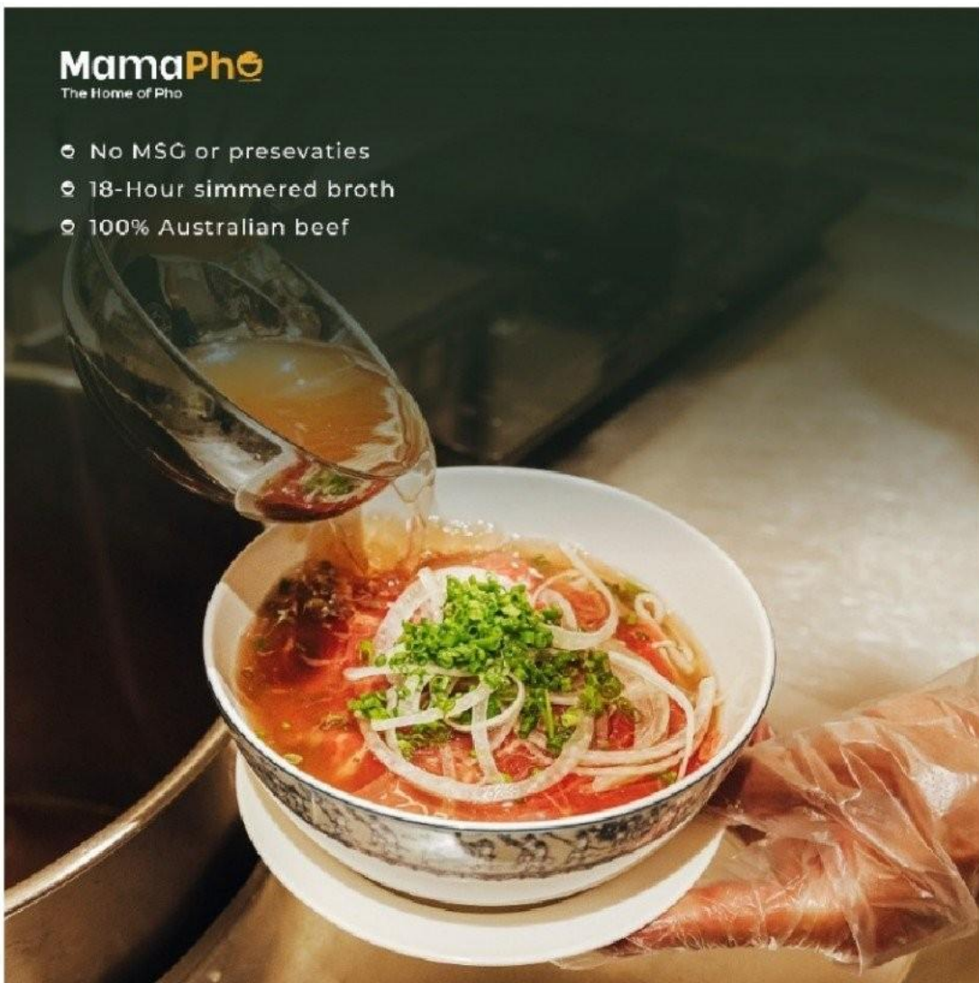
Tiêu chí khác biệt của MamaPho